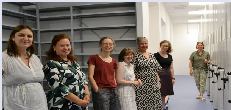
Oben: Arcinsys-Einsteigerschulung im Herbst 2024